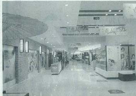
2号店の出店を予定している上海・新天地にある高級スーパー